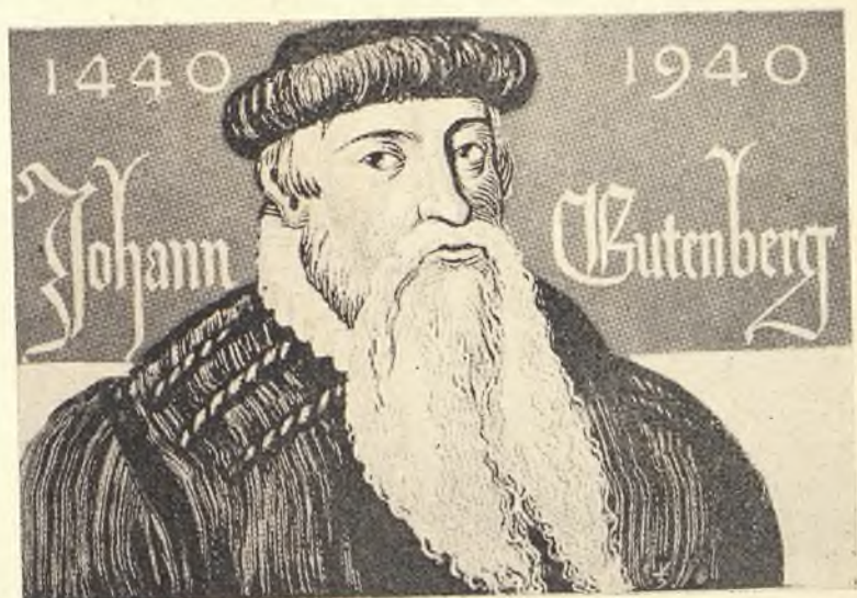
GUTENBERG. INVENTOR DE LA IMPRENTA EN 1440