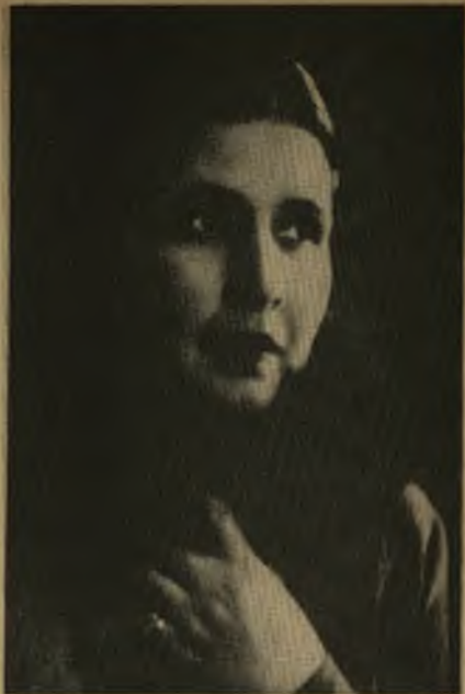
Teresa de la Parra, 1927, Suiza, fecha de gestación de Las Memorias de Mamá Blanca