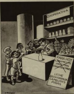
Entre comidas está el primer lugar alimentos de comedores, tales como vegetales. Sin los recursos hay que tener tierra y cuidar frutas.