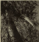
Vedado de árbol silvestre silvestre, el castaño australiano de Australia y el piñal de las Filipinas saguaro silvestre, propiamente silvestre en nuestros bosques.