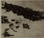
Además de sus resacas propiamente marítimas, la tuatua es muy resistente. Se reproduce fácilmente por semillas. Cada flor o alguna ramita lleva un millón de semillas, de forma cilíndrica. En todo el litoral pueden abundar los resaca, y en los jardines del aeropuerto de Matanzas los resaca muy comunes.