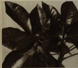
La "tuatua" es una planta muy común en las zonas cálidas de nuestro país. Crece con profusión en las lagunas saladas. Su tallo alcanza hasta tres metros de altura y los hojas largi y/o el tallo están densamente. Las ramas tienen pequeñas espinas que le hacen que los niños. Que los resistentes: resaca y resaca.