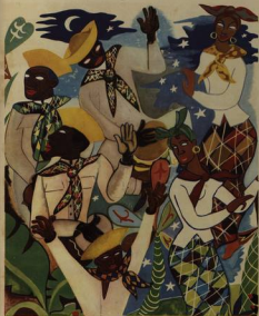
EL BAILE DE SAN JUAN

En Yare, donde se baila desde el tiempo de los españoles, los diablos representan al pecado y muchas veces se les dice "diablos de Yare". En la danza, los bailarines usan máscaras de madera y se les dice "diablos", que hoy en día se usan para bailar y cantar.