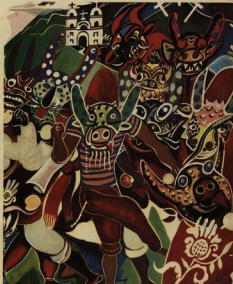
DIABLOS DANZANTES DE YARE

La danza de los diablos de San Francisco de Yare es una de las más antiguas y más variadas manifestaciones folclóricas. Músicos y bailarines, vestidos de rojo y con máscaras, siguen al ritmo de la Iguala el día de Corpus, cuando salen de la ciudad a bailar y cantar en las plazas y en las casas.