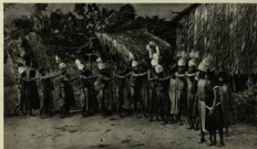
Esta es el bello aspecto del "chirimón" o sea el de la danza sagrada. Los indios, con un collar de plumas de maricón tallado con cuidado y una de diadema

roble, giran en círculo desde las diez de la noche hasta las once de la mañana del día siguiente. Este baile es la conmemoración del "varanano", que es siempre diverso.