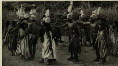
El círculo de hombres, mujeres y niños bailan con entusiasmo el "chirimón" con un collar adornado para ellos. A pesar de la repugnancia que sienten por los indios

roble, giran en círculo desde las diez de la noche hasta las once de la mañana del día siguiente. Este baile es la conmemoración del "varanano", que es siempre diverso.